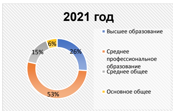
Диаграммы - Занятое население по уровню образования

Уровень образования - один из основных факторов, определяющих положение человека на рынке труда [5]. Чем выше уровень образования, тем выше уровень занятости. Эта закономерность наблюдается как для мужчин, так и для женщин, хотя влияние уровня образования на занятость несколько выше для женщин.